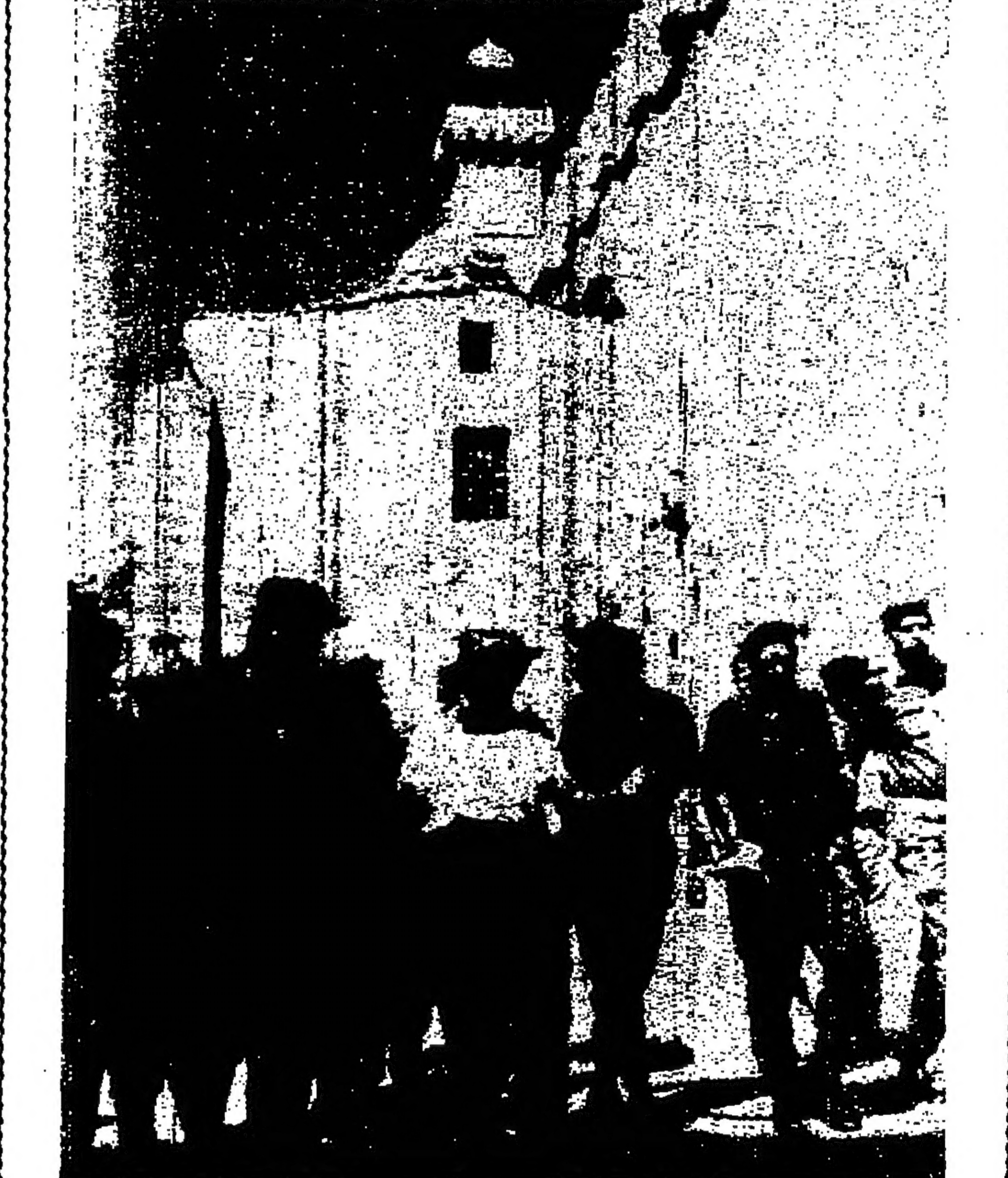
زار موشيه دايان وزير الدفاع الإسرائيلي الحرم الابراهيمي اول امس على اثر حادث اقاء القنبلة الذي ادى الى مقتل واصابة نحو خمسين إسرائيلياً في الصورة دايان يحيط به جنود وبيدو في اعلى الصورة باقعة الصرم الشريف